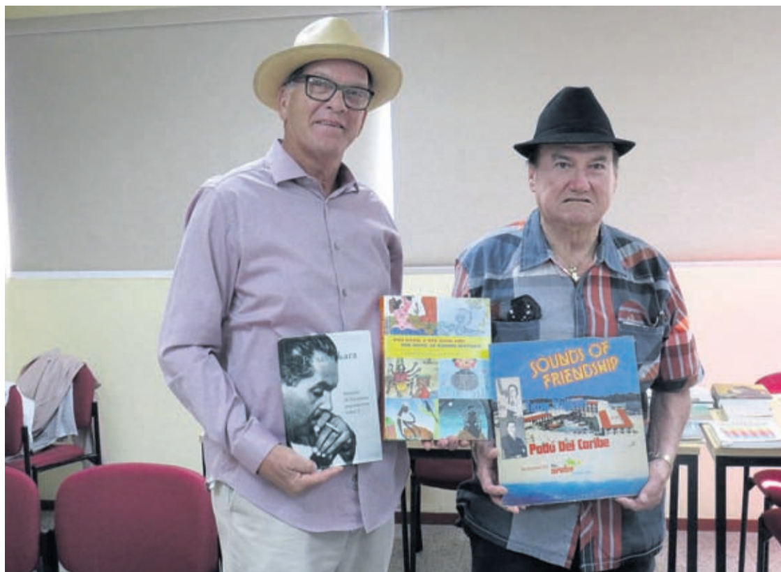
ORANJESTAD – Biblioteca Nacional Aruba lo tin nan actividad ‘pa un bon comienso di aña nobo 2020 riba diaranson 22 di januari, for di 6:30 pm te cu 9:30 pm na George Madurostraat.